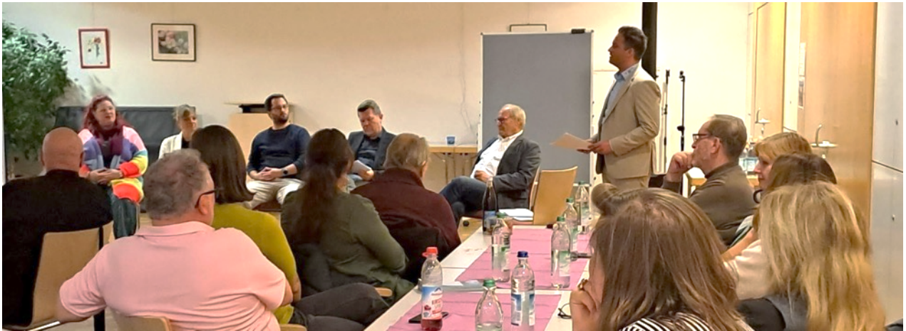
Organisiert von der ARGE: Podiumsdiskussion zum Thema Soziale Not im Hofbergsaal Pfaffenhofen

Für das kommende Jahr wird der thematische Schwerpunkt der ARGE auf der Sozialraumorientierung liegen. Auch hier spielt die Vernetzung eine zentrale Rolle, um gemeinsame Strategien zu entwickeln und soziale Angebote noch gezielter auf die Bedarfe der Menschen im Landkreis abzustimmen.