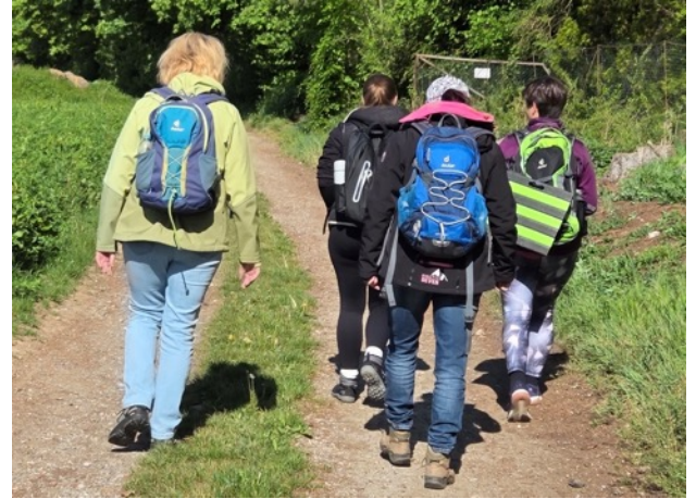
Viel Freude hatten die TPPs bei der Fobi im Freien zum Thema „Resilienz und Achtsamkeit – Gemeinsam durchatmen und Kraft schöpfen“