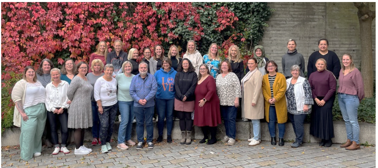
Klausurtag 2025 – ein paar der TPPs trauten sich leider nicht mit dem KKT-Team aufs Bild

Im Rahmen des jährlichen Klausurtags konnten wir erneut zahlreiche informative Programmpunkte präsentieren. Zu den Gästen zählten unter anderem Vertreter der AWO und A.P.E., die ihre vielfältigen Beratungsangebote vorstellten. Ebenso war eine Vertreterin des Landratsamts Pfaffenhofen anwesend, die den Tagespflegepersonen für Fragen und Austausch zur Verfügung stand. Darüber hinaus präsentierten wir unser Fortbildungsprogramm für 2026 sowie weitere wichtige Themen und Neuerungen rund um die Kindertagespflege. Der Klausurtag bot somit eine wertvolle Plattform für den fachlichen Austausch und die Vernetzung aller Beteiligten.