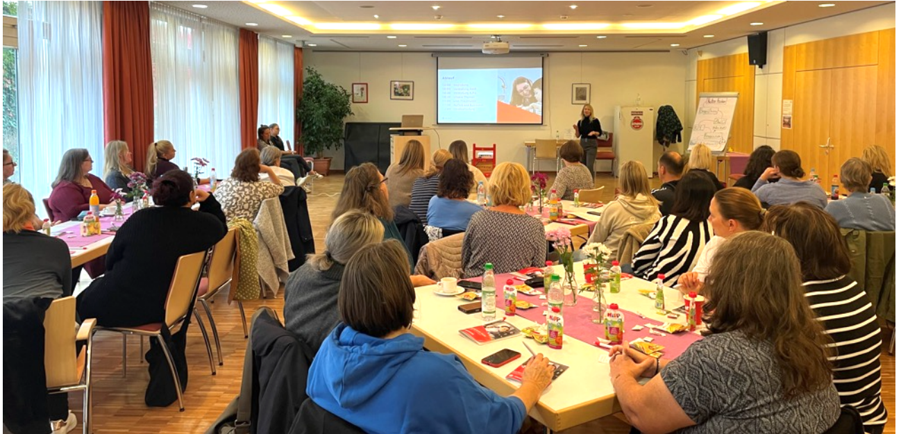
Klausurtag 2025 im Hofbergsaal