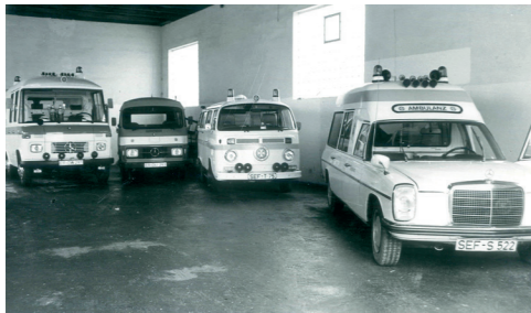
Einsatzfahrzeuge der Rettungswache 1978

Wir haben dieses Jahr gleich doppelten Grund zu feiern: Im September begehen wir den 50. Geburtstag der Rettungswache Schlüsselfeld sowie den 10. Geburtstag der Sozialstation Schlüsselfeld. Zusammen über 60 Jahre setzen sich unsere haupt- und ehrenamtlichen Mitarbeitenden in Schlüsselfeld für andere Menschen ein und stehen ihnen im Rettungsdienst und in der ambulanten Pflege Tag für Tag zur Seite. Das wollen wir sehr gerne mit Ihnen feiern!