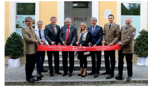
Einweihung der Sozialstation im April 2015

Als oberfränkische Johanniter laden wir Sie deshalb bereits jetzt herzlich ein