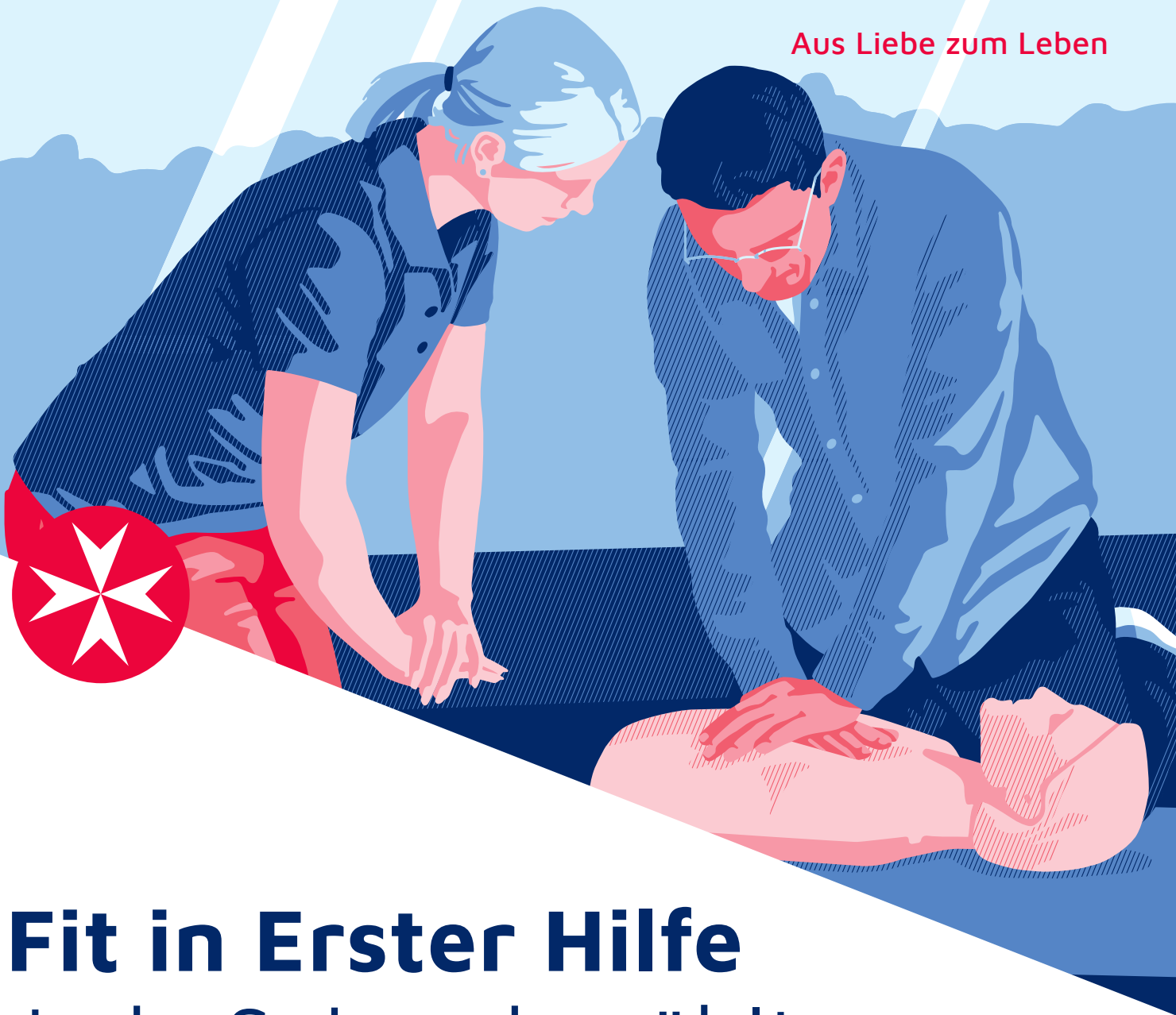
Illustration: COXORANGE/Lillian Vater