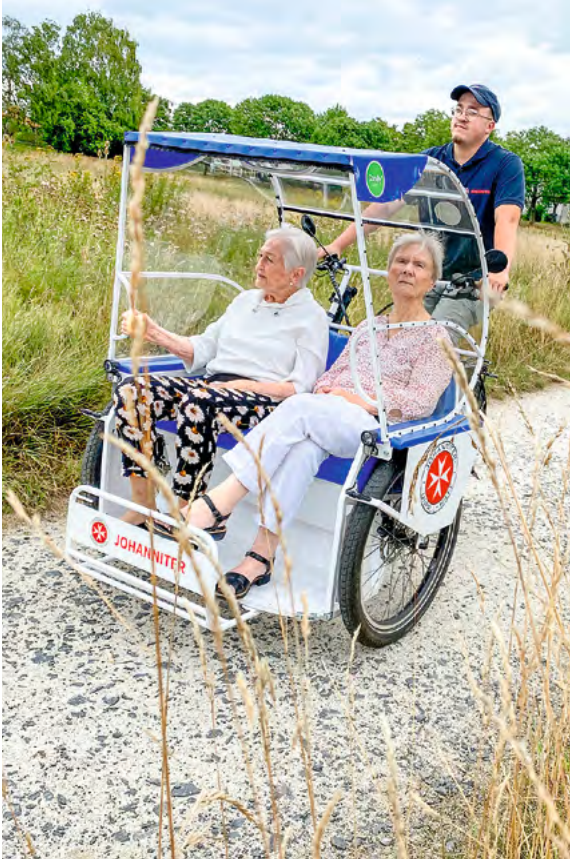
Auch im hessischen Liederbach am Taunus gibt es die begleiteten Ausfahrten – wenn das Wetter mitspielt.

in Siegburg einen Ort zu kennen, wo ihr auch mal geholfen wird, wenn es etwa um Behördenschreiben oder Anträge für finanzielle Unterstützung geht. Und bei denen man auch einfach mal auf einen Plausch vorbeikommen kann.