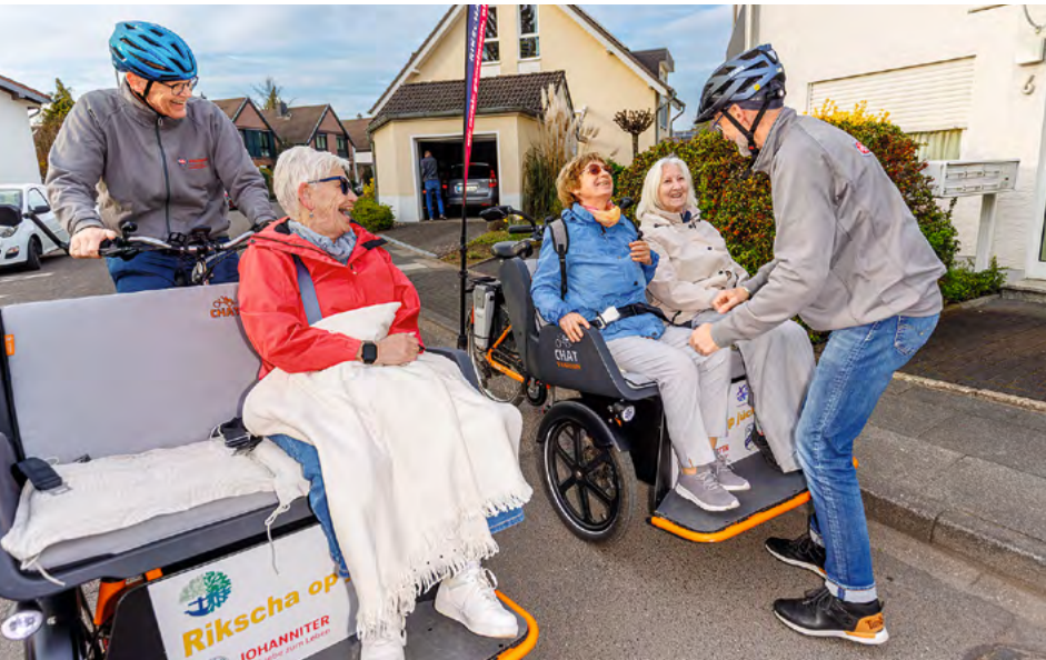
Zuhause abgeholt, wieder zuhause abgeliefert: Das Rikscha-Taxi kommt wie gerufen.