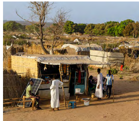
Boro Medina, an der Grenze zum Sudan, ist für Tausende geflüchteter Menschen ein Zufluchtsort geworden. Die Johanniter unterstützen dort mit medizinischer Hilfe.

Die Johanniter sind seit 2011 im Südsudan aktiv und genießen durch dieses langfristige Engagement zum Wohle der Menschen großes Vertrauen vor Ort. In den Bereichen Gesundheit, Ernährungssicherung und WASH (Wasser, Hygiene und Sanitär) können sie durch ihre Bekanntheit und die damit verbundene gute Vernetzung mit anderen Organisationen und staatlichen Stellen auch Regionen erreichen, die sonst fernab von humanitärer Hilfe liegen. Vor allem im medizinischen Bereich, durch den Einsatz von mobilen Kliniken und das Netz von Gemeindegesundheitsshelfenden, werden die Johanniter überall willkommen geheißen.