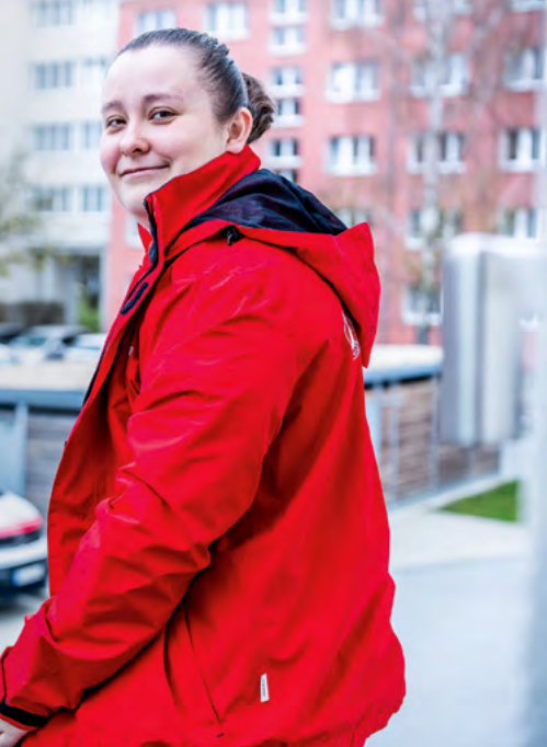
ommunikation, ist ehrenamtliche Erste-Hilfe-Trainerin us.

Alarmierung. Wenn zum Beispiel jemand beim Anziehen der Jacke den Notfallknopf drückt.