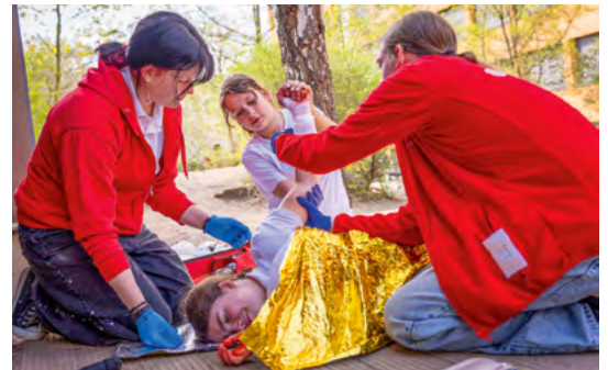
Bei der Ersten-Hilfe ist oftmals Teamwork gefragt.

haben Dutzende Verletzungen nach allen Regeln der Kunst geschminkt. Die Aufgaben für die Teilnehmenden: keinen Hinweis übersehen, in der richtigen Reihenfolge versorgen und gleichzeitig die Verletzten beruhigen. Die Einsätze fanden unter den kritischen Blicken der erfahrenen Auszubildenden statt. Im Nachgang gab es wertvolle fachliche Hinweise und die Chance, das Vorgehen unter Aufsicht noch einmal zu üben.