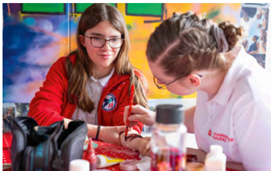
Kinderschminken der besonderen Art: Das Team der Realistischen Unfalldarstellung (RUD) bei der Arbeit.

Alle 180 Teilnehmenden des Erste-Hilfe-Wochenendes durchlaufen am 18. April 2026 solche Szenarien im Leipziger Montessori-Schulzentrum. Die Schülerinnen und Schüler sind zwischen 6 und 17 Jahre alt und treffen sich einmal jährlich, um gemeinsam ihr Erste-Hilfe-Wissen in Wettkampfstationen unter Beweis zu stellen. Sie rufen Routinen ab, die sie schon unzählige Male