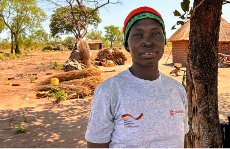
Amjuma kommt mit ihrer Hilfe im Südsudan bislang auch noch in verlassene Gegenden.