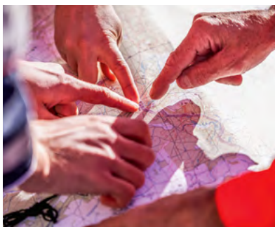
Organisationsübergreifende Übungen gehören auch zur Resilienzstärkung.

Auch der Ausbau moderner Kriseninfrastruktur durch autarke Katastrophenschutzzentren (»Akkon«-Konzept) hilft Sachsen im Bereich Krisen- und Bevölkerungsschutz nachhaltig. Diese Einrichtungen stellen sicher, dass unsere Einsatzkräfte auch bei flächendeckenden Stromausfällen einsatzfähig