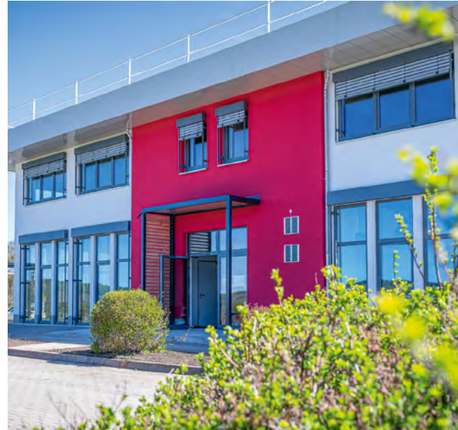
Von Außen erstrahlt das »Akkon« Aue bereits in neuem Glanz. Im Innenbereich sind noch ein paar letzte Handgriffe notwendig.

bestehenden Rettungswache in Aue-Bad Schlema und soll diese im Normalbetrieb unterstützen. Neben Fahr- und Einsatznotrufdienst finden hier auch Ausbildungs- und Seminarräume sowie Trainingsstationen für die Aus- und Fortbildung im Rettungsdienst Platz.