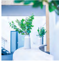
Freundlich und modern sieht es auch innen aus.