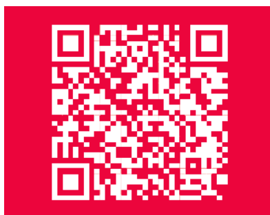
Ein Stück Sicherheit im Alltag: Download der Broschüre »Für alle Fälle«

bleiben. Flankiert wird diese Infrastruktur durch die exzellente Ausbildung der Ehrenamtlichen. In realistischen Einsatzübungen trainieren sie den Umgang mit extremen Stresssituationen und komplexen Bedrohungslagen.