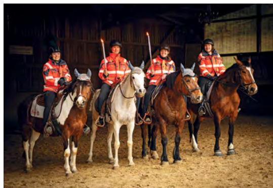
Johanniter-Pferde: Gelassen und verlässlich.

Die Pferde der Reiterstaffel sind im Besitz der ehrenamtlichen Reiter, die ihr Hobby mit ihrem Engagement für die Gemeinschaft verbinden. Dank der Unterstützung unserer Fördermitglieder werden Trainings, Spezialkurse wie das Feuertraining, Material und die tiergerechte Vorbereitung der Pferde möglich. Dafür danken wir Ihnen herzlich.