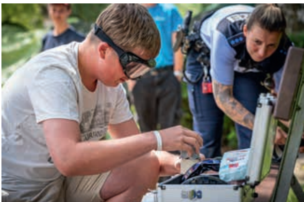
Geschicklichkeitstest unter erschwerten Bedingungen: Die Brille simuliert das Sehen bei Trunkenheit.