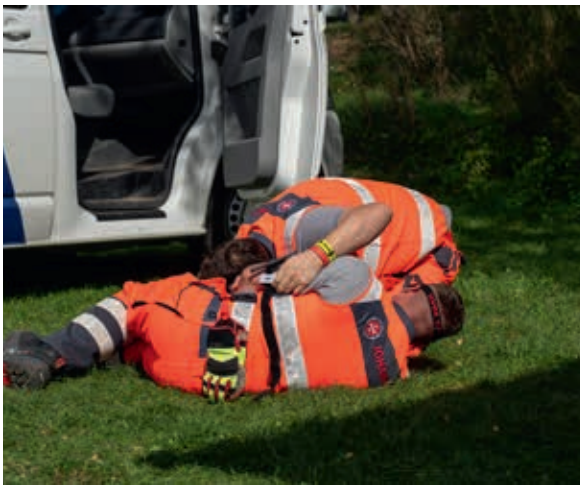
Erste Regel in Gefahrensituationen: Selbstsicherung.

radstaffel sowie zwei Teams für Psychosoziale Notfallversorgung, die sich nach belastenden Ereignissen sowohl um Betroffene als auch Einsatzkräfte kümmern.