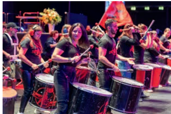
Schwungvoller Einstieg: Die Trommler von Como Vento sind Stammgäste beim Bundeswettkampf.