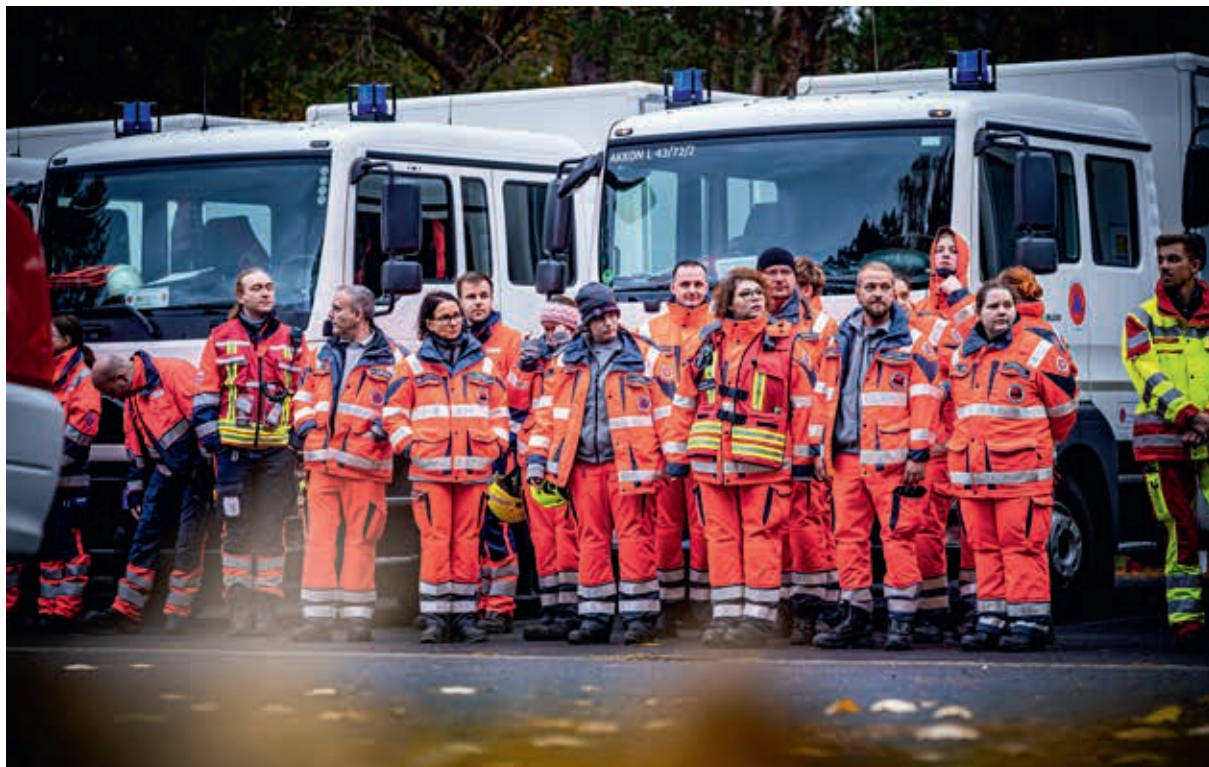
Das MTF-Team aus dem Regionalverband Leipzig/Nordsachsen wird in die Tagesaufgaben eingewiesen.

Rund 100 Einsatzkräfte der Johanniter und fünf weiterer Organisationen haben in der Annaburger Heide unter realistischen Bedingungen verschiedene Einsatzszenarien geübt. Im Mittelpunkt standen Teamarbeit, Notfallmedizin und neue Ausstattung für chemische, biologische, radiologische und nukleare Gefahren (CBRN).