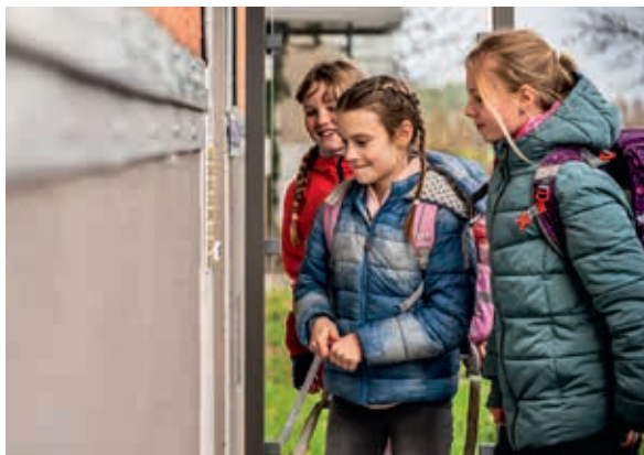
Die Schülerinnen der Emil-Ufer-Grundschule werden schon freudig im Betreuten Wohnen erwartet.

Mehlstaub in der Luft, Kinderlachen im Raum und jede Menge Kekse im Ofen. Im Betreuten Wohnen in Olbersdorf, nahe Oybin, sind die Kinder los! Jede Woche besuchen Schülerinnen und Schüler der Emil-Ufer-Grundschule ihre etwas „älteren Freunde“ in der Töpferstraße.