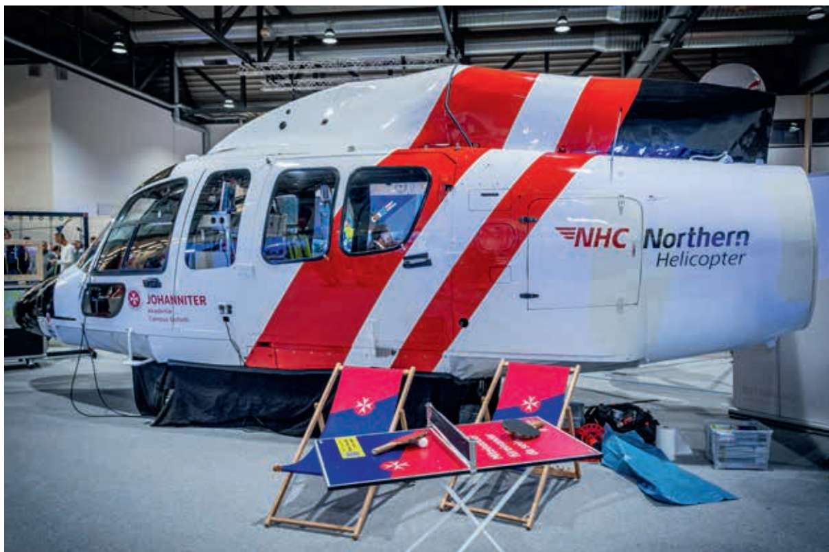
Ein echter Hingucker: Die Übungskabine des H155-Helikopters des Teams Offshore-Projekte zog viele Interessierte an den Stand.

Mitten im bunten Treiben der Fachmesse FLO-RIAN in Dresden wurde der Stand der Johanniter zu einem echten Hotspot für moderne Rettung, Leidenschaft und Teamgeist. Unter dem Motto „Einsatzstärke zum Anfassen“ präsentierten die Johanniter auf dem Gelände der Messe Dresden, wie lebendig und vielfältig das Thema Rettung und Notfallhilfe ist. Das Beste: Jede und jeder können Teil dieser starken Gemeinschaft werden.