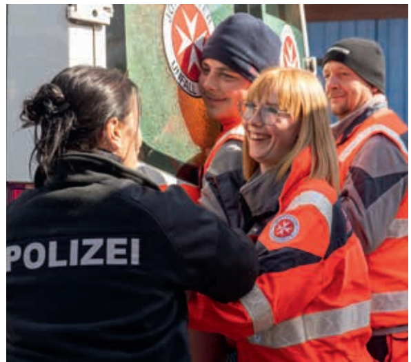
Wie kann man gewalttätige Patienten sanft sichern? Die Selbstverteidigungsexpertin der Polizei zeigt, wie es geht.

Die Bevölkerungsschutztage fanden zum dritten Mal statt, dieses Mal an der Talsperre Pirk im Vogtland. Neben den ernstesten Ausbildungsinhalten standen die malerische Umgebung und die Gemeinschaft im Mittelpunkt. Den Tag am Lagerfeuer ausklingen zu lassen und morgens ins blaue Nass zu springen, rundete für viele die Veranstaltung ab.