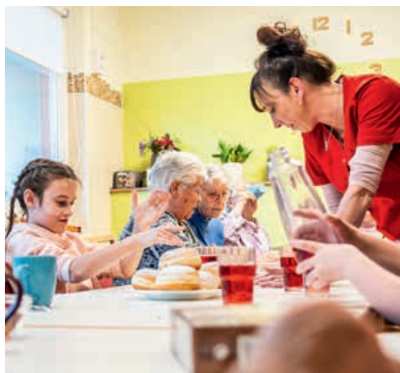
Der Aufenthaltsraum wird zur weihnachtlichen Backstube.

Nachdem alle Szenen im Kasten sind, resümiert auch das ZDF-Team, wie schön die Eindrücke waren und freut sich über die Fülle an Material, das jetzt sortiert, geschnitten und zu einem Beitrag zusammengesetzt werden muss. Das Wichtigste allerdings: das Angebot geht weiter – und es gibt schon viele Ideen für nächste Besuche.