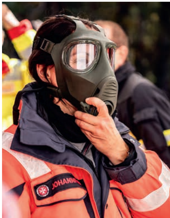
Der Umgang mit der neuen CBRN-Ausrüstung sitzt schon sicher.

Bei all den relevanten Aktivitäten stand vor allem die Zusammenarbeit der verschiedenen Hilfsorganisationen im Fokus. Neben 15 Johanniterinnen und Johannitern nahmen auch Einsatzkräfte von Feuerwehr, Maltesern, DRK, ASB und Falck an der Übung teil. So wurde nicht nur technisches Wissen vertieft, sondern auch das Miteinander und die Kommunikationswege zwischen den Organisationen gestärkt. Solche Übungstage zeigen, wie wichtig gemeinsames Handeln und regelmäßiger Austausch für den Ernstfall sind.