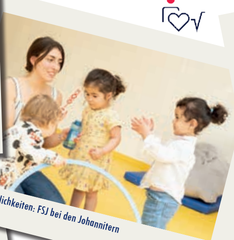
1 Jahr x Möglichkeiten: FSJ bei den Johannitern