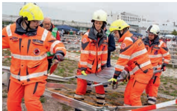
Allen Altersgruppen wird viel abverlangt in Theorie und Praxis.