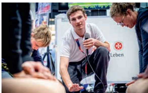
Highlight: Das Reanimations-Race fordert Kraft und Ausdauer.

Mitten im bunten Treiben der Fachmesse FLO-RIAN in Dresden wurde der Stand der Johanniter zu einem echten Hotspot für moderne Rettung, Leidenschaft und Teamgeist. Unter dem Motto „Einsatzstärke zum Anfassen“ präsentierten die Johanniter auf dem Gelände der Messe Dresden, wie lebendig und vielfältig das Thema Rettung und Notfallhilfe ist. Das Beste: Jede und jeder können Teil dieser starken Gemeinschaft werden.