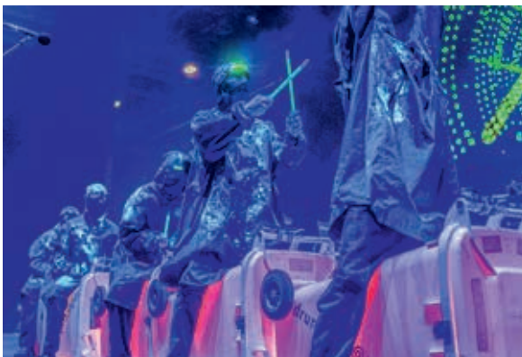
Da wippt jedes Bein: „Rabazz“ bringen den Saal in Bewegung.