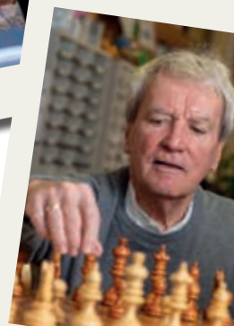
Zug um Zug: Schach-AG für Geflüchtete