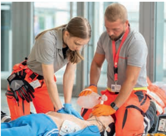
Standardübung: Herz-Lungen-Wiederbelebung gehört für die Profis der S-Mannschaft zum Alltag.