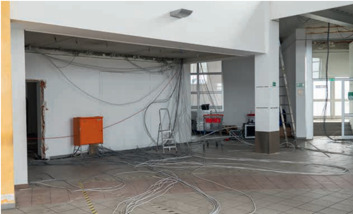
Das ehemalige Autohaus in Aue-Bad Schlema kurz vor dem Umbau zum Katastrophenschutzzentrum. Hier entsteht das Foyer.