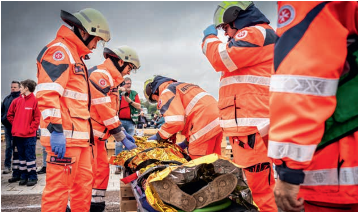
Geschäft – Der Patient ist versorgt, das Rettungsteam hat optimal zusammengearbeitet.