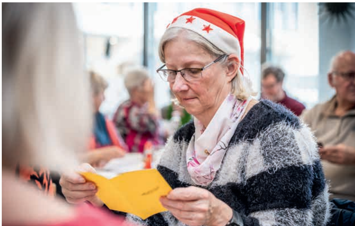
Die Post gegen Einsamkeit erreicht ihre Adressaten beim Essen gegen Einsamkeit im Kochkessel Leipzig.

Die Weihnachtszeit gilt als Fest der Liebe und der Gemeinschaft. Doch für viele Seniorinnen und Senioren in Sachsen ist sie oft die leiseste Zeit des Jahres. Wenn die Tage kürzer werden und die festliche Beleuchtung in den Fenstern der Nachbarn erstrahlt, wird die eigene Einsamkeit oft besonders schmerzhaft spürbar.