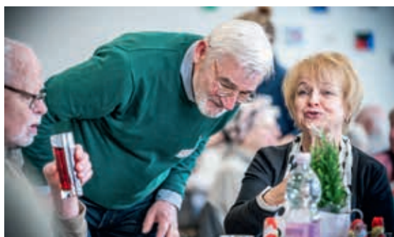
Ein Landesvorstand als Kellner serviert Entenbraten.

Die Johanniter in Sachsen setzen hier ein deutliches Zeichen: Mit Herzblut, warmen Mahlzeiten und handgeschriebenen Briefen kämpfen sie dafür, dass niemand allein bleiben muss.