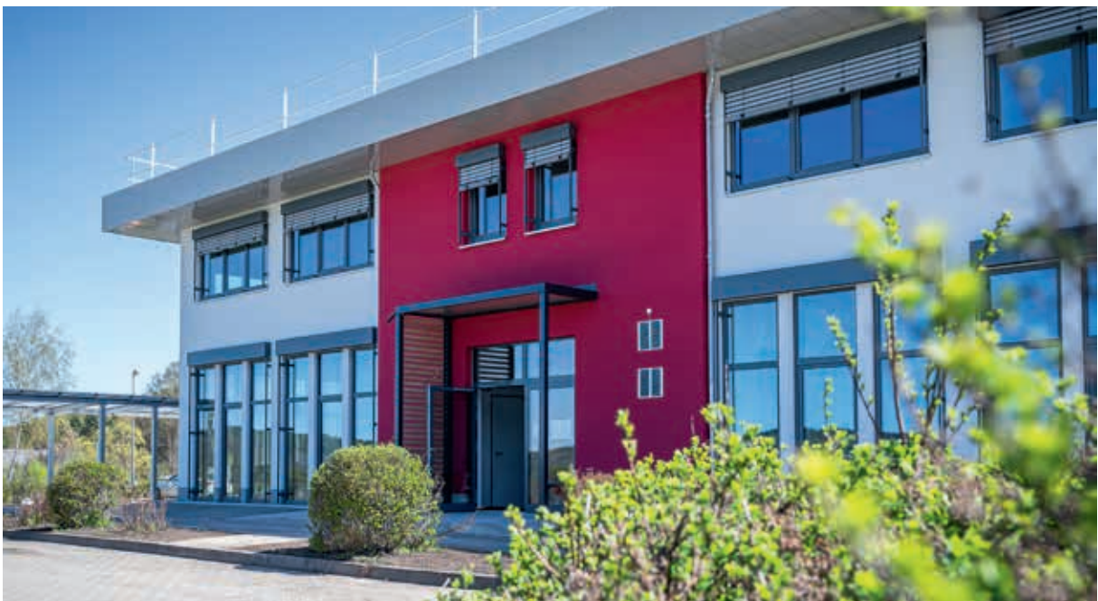
Der Innenausbau läuft, auch an der Fassade fehlen nur noch Kleinigkeiten.

*Der Name „Akkon“ bezieht sich auf die Stadt Akkon (heute Acre in Israel). Dort befand sich im 11. bis 13. Jahrhundert die letzte Festung des Johanniterordens im Heiligen Land.