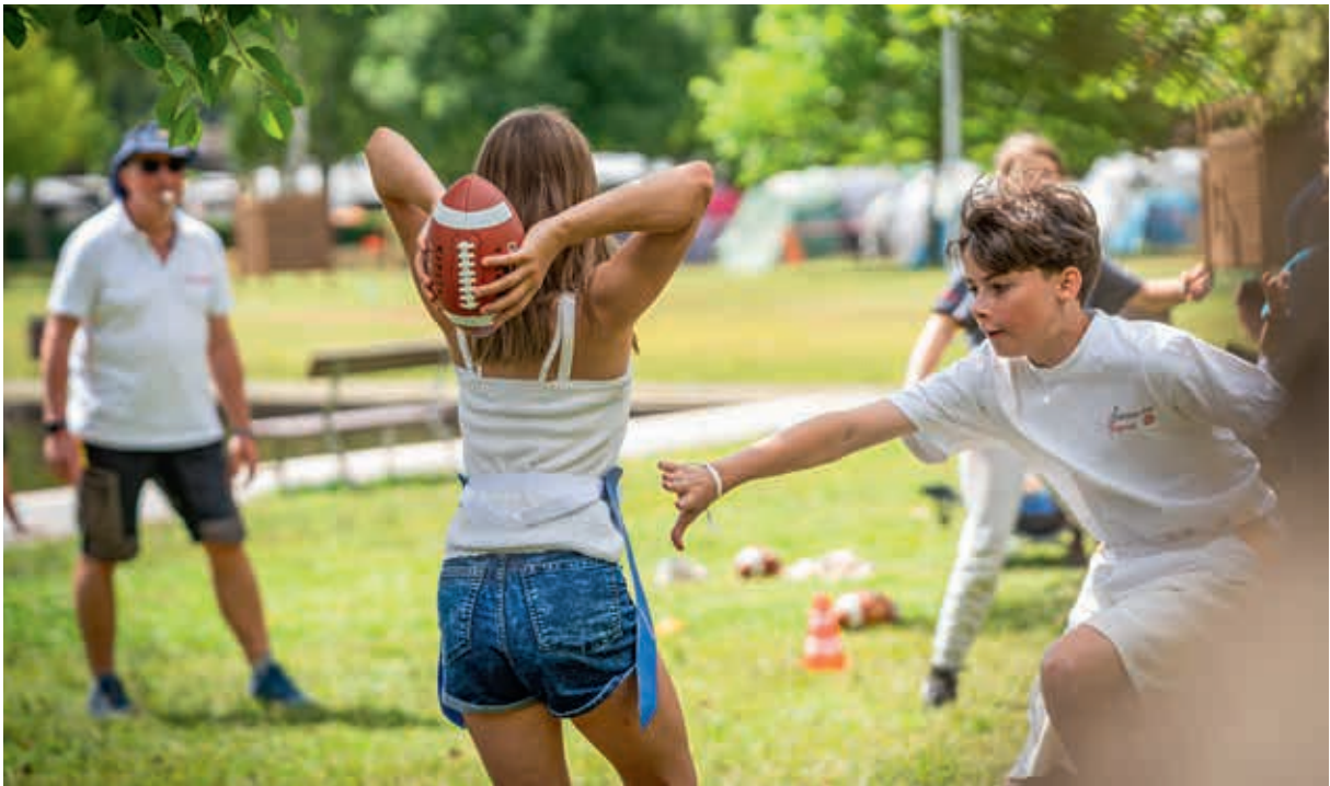
Beim Flag-Football geht es darum, das farbige Band der gegnerischen Mannschaft zu erbeuten.