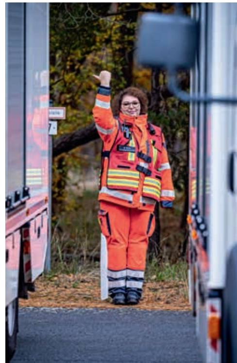
Voller Fokus: 25 Fahrzeuge müssen eingewiesen werden.