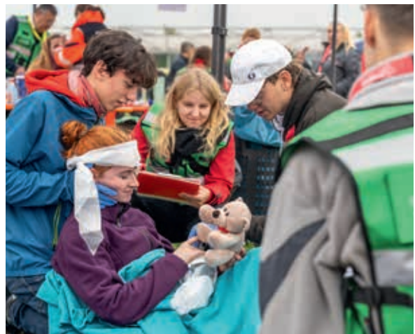
Titelverteidiger: Die B-Mannschaft aus dem Regionalverband Leipzig/Nordsachsen auf dem Weg zum Sieg.