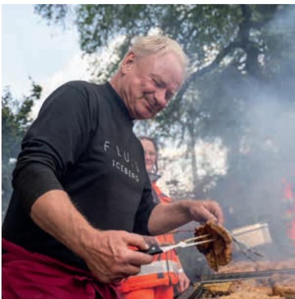
Am Ende des Tages warten gutes Essen, kühle Getränke und „familiäre“ Gespräche auf die Kameradinnen und Kameraden.