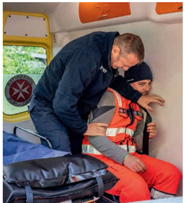
Was zu tun ist, wenn ein Patient im Rettungswagen handgreiflich wird, wurde ebenfalls geübt. Wichtig: Sichern ohne zu verletzen!

In Sachsen sind in den neun Einheiten des Bevölkerungsschutzes sowie in den Schnelleinsatzgruppen über 500 ehrenamtliche Johanniterinnen und Johanniter aktiv. Dazu gehören auch zwei Rettungshundestaffeln, eine Motor-