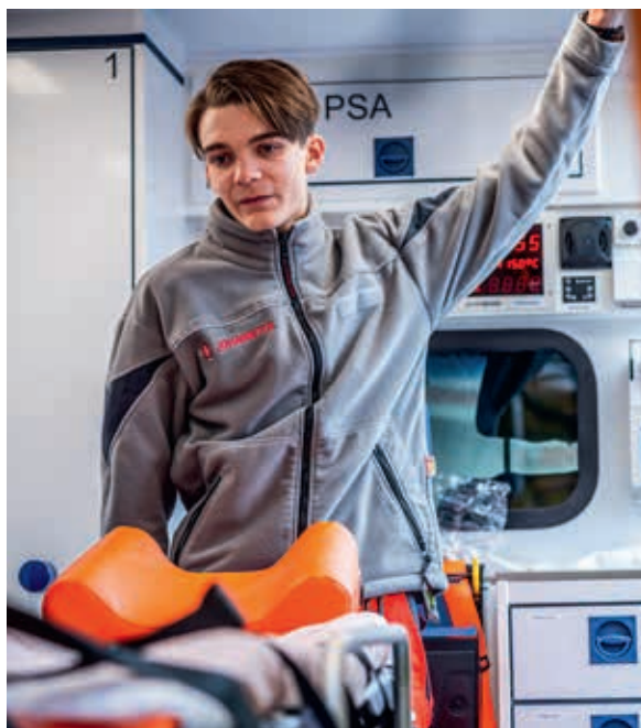
Im Außenbereich wurde Neugierigen erklärt, wie der neue Krankentransportwagen Bund (KTW-Bund) aufgebaut ist.

che aus dem RV Dresden Rettungseinsätze in der Landwirtschaft. Zum Beispiel die Bergung einer Person aus der Kornkammer eines Mähdreschers oder aus einem verunfallten Fahrzeug nach Kollision mit einem Traktorflug. Wichtig dabei: gute Kommunikation, eingespielte Teams und innovative Technik. Ebenfalls im Außenbereich stellte der Katastrophenschutz den neuen Krankentransportwagen-Bund (KTW-Bund) der Medical Task Force (MTF) vor. Am Samstag begeisterte dort die Rettungshundestaffel aus Dresden mit beeindruckenden Vorführungen.