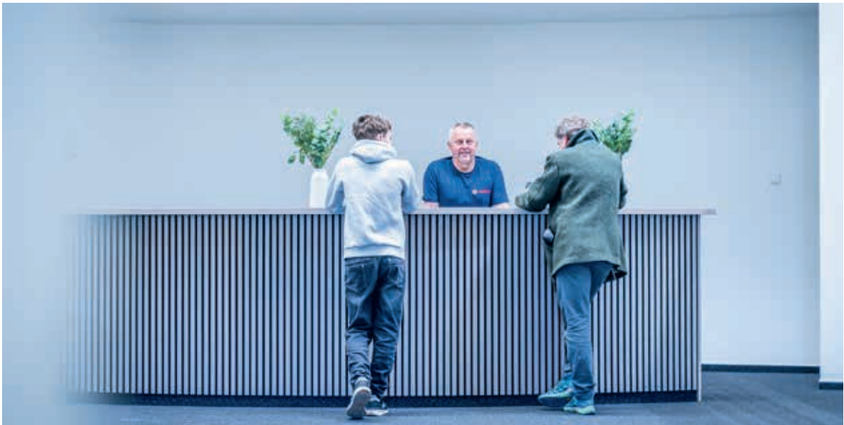
Das fast fertige Foyer – Eröffnung am 19. Juni 2026.

Dresden erwarb dort ebenfalls ein Autohaus und baute es zum Katastrophenschutzzentrum um. Im Krisenfall können hier bis zu 1.000 Personen autark untergebracht und betreut werden.