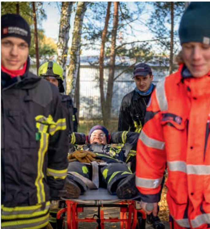
Teamwork: Johanniter und freiwillige Feuerwehr arbeiten Hand in Hand.

Gegen 15:30 Uhr kehrten die Teilnehmenden geschafft, aber zufrieden nach Hause zurück; mit vielen neuen Eindrücken und bestens gerüstet für die nächsten Einsätze.