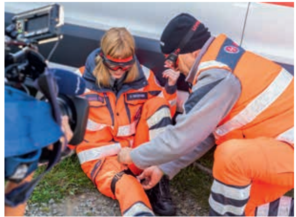
Auf Schritt und Tritt dabei – die Kamera für einen MDR-Beitrag.