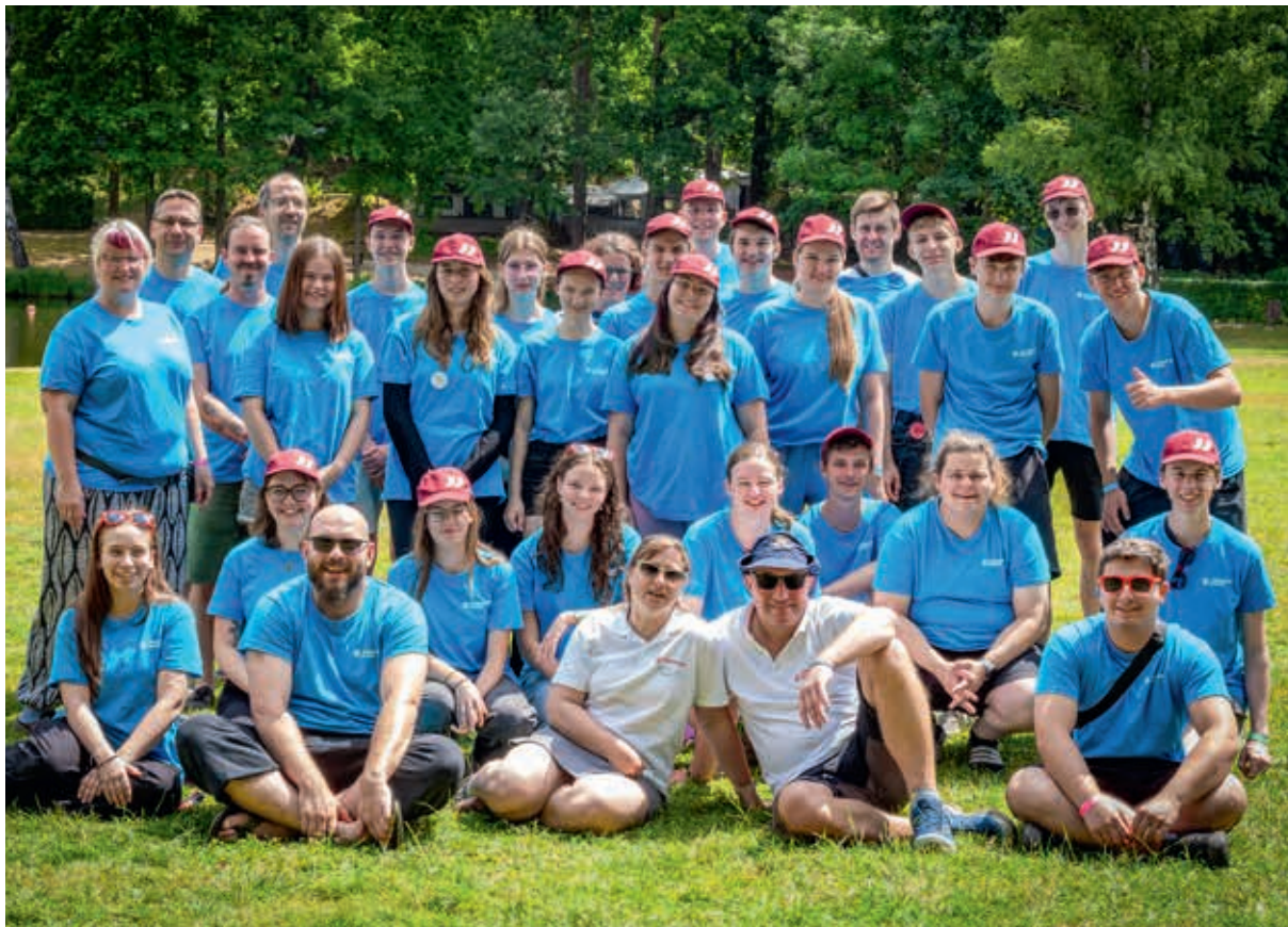
Die Betreuerinnen und Betreuer der Johanniter-Jugend brachten „Griechenland“ kurzerhand nach Meißen.