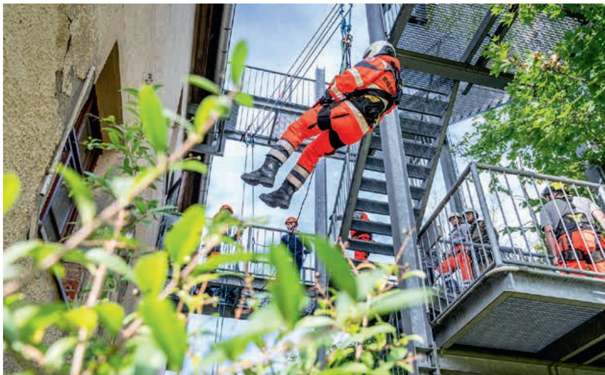
Johanniter trainieren gemeinsam mit der Feuerwehr das Abseilen aus großen Höhen.

Bei den Bevölkerungsschutztagen sind die Johanniter von ihren Standardtrainings abgewichen. Geübt haben sie die erstmedizinische Versorgung bei Bedrohungs- und Terrorlagen. Zudem haben die 80 ehrenamtlichen Bevölkerungsschützerinnen und -schützer aus ganz Sachsen mit der Feuerwehr Plauen trainiert, wie man Menschen aus großen Höhen rettet. In weiteren Workshops gemeinsam mit der Polizei ging es um den Selbstschutz in engen Räumen, beispielsweise bei gewalttätigen Patienten im Rettungswagen. Über Stress im Einsatz und die psychische Bewältigung tauschten sich die Teams für psychosoziale Notfallversorgung aus.