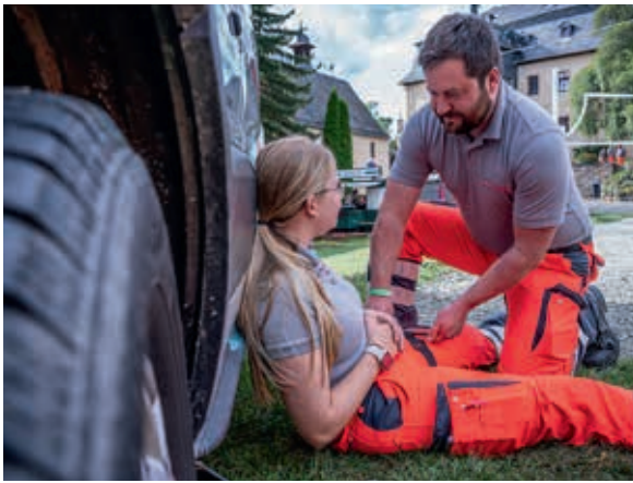
Training einer Terrorlage: Ein Auto bietet etwas Schutz in der Not.