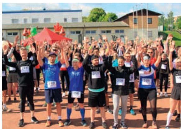
Die Beneflitz-Spendenläufe begeistern jedes Jahr auf Neue: Sport für den guten Zweck? Eine echte Win-Win-Situation!

Um solche Events auf die Beine zu stellen, braucht es tatkräftige Unterstützung. Dafür sorgen viele Helferinnen und Helfer, die sich im Vorfeld um die Organisation kümmern oder während der Events unterstützen – ohne diese