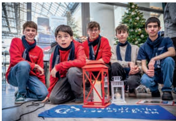
Die Johanniter-Jugend verteilt das Friedenslicht.

Weitere Informationen zum Engagement gegen Einsamkeit finden Interessierte unter: johanniter.de/einsaminsachsen