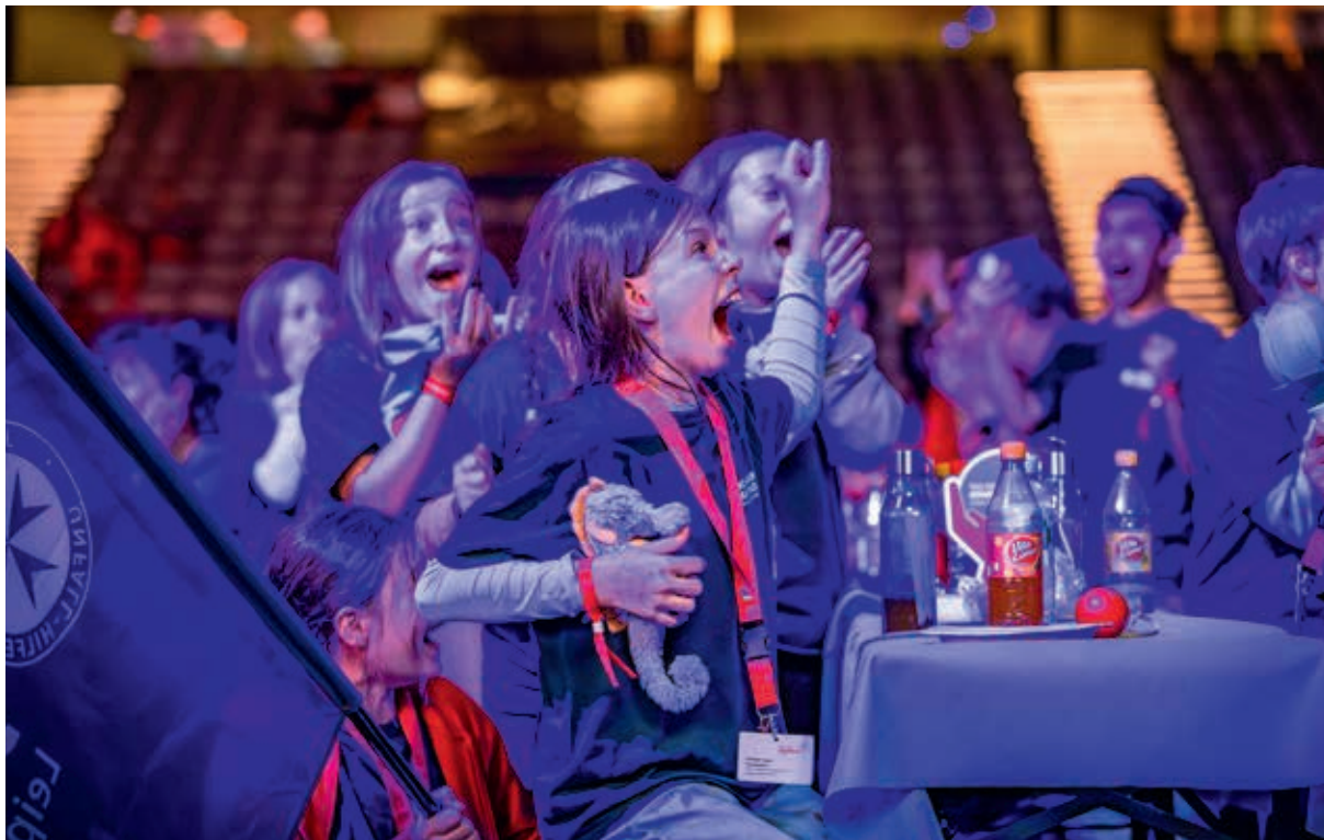
Ein Urschrei! Den Schülerinnen und Schülern der C-Mannschaft aus Leipzig wird klar: Wir haben gewonnen!

Die besten Nachwuchsretter Deutschlands kommen aus Leipzig! Das konnte die Johanniter-Jugend vom Regionalverband Leipzig/Nordsachsen beim Bundeswettkampf in Erster Hilfe unter Beweis stellen. In den Kategorien B (Jugendliche von 12-18 Jahren) und C (Kinder von 6-11 Jahren) kamen sie jeweils auf den 1. Platz. Das B-Team hat damit seinen Titel von 2023 verteidigt.