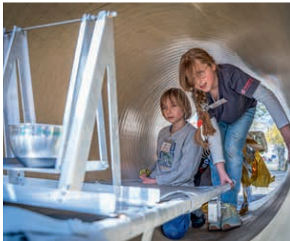
Nur kein Wasser „verschwappern“: Der Trageparcours mit Hindernissen ist eine echte Herausforderung.

nen, werden auch Geschicklichkeitsparcours für den Patiententransport, Techniken für Verletzte mit Sturzhelm sowie Teamaufgaben angeboten, die Fingerspitzengefühl und Taktik fordern. Zusätzlich sensibilisieren Workshops die jungen Menschen für Themen wie „Demokratie retten“ und „Nachhaltigkeit“.