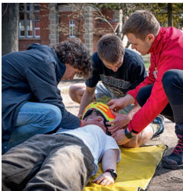
Der Helm muss runter – aber sehr, sehr vorsichtig.

Das Angebot der Stationen ist vielfältig und auf weit mehr als „nur“ Erste Hilfe ausgelegt. Neben klassischen Aufgaben wie Wiederbelebung und Herz-Druck-Massage, richtige Wundversorgung und das Erkennen spezifischer Gefahrensituatio-