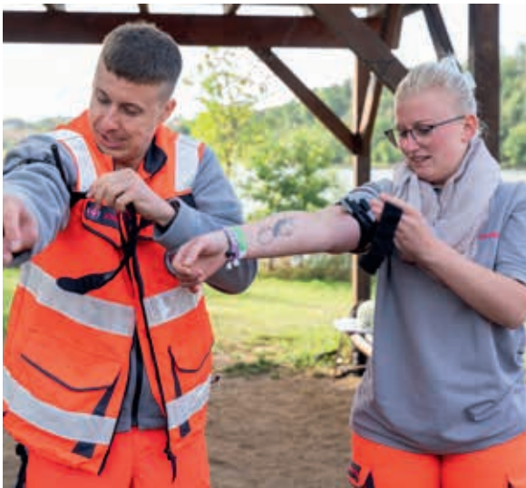
Das Team der Erzieherinnen und Erzieher aus dem KV Erzgebirge übt das Abbinden mit einem Tourniquet.