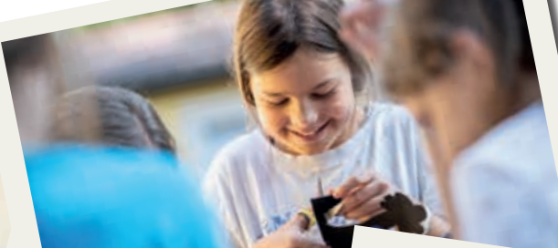
Tolle Tage im Sommerlager der JJ