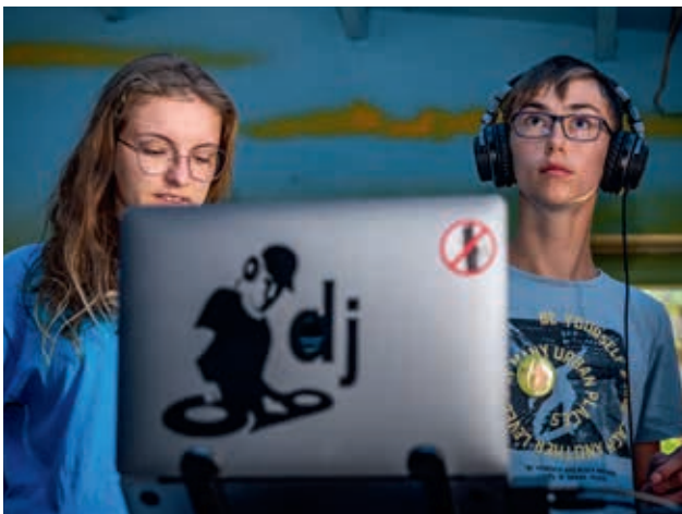
Be a DJ! Musikalische Profis vermitteln das Handwerkzeug dazu.