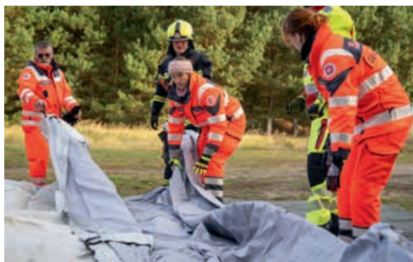
Routiniert und schnell entsteht hier ein Behandlungsplatz.

Die Stations- und Gruppenarbeit reicht von Orientierung im Gelände mit Karte und Kompass bis hin zum Training mit Schutzausrüstung und Dekontamination. Zudem standen medizinische Notfallmaßnahmen auf dem Programm: Die Teilnehmenden trainierten, wie Blutungen zügig und korrekt mit Tourniquet und Emergency Bandage gestillt werden sowie den Umgang mit der Beckenschlinge – wichtige Maßnahmen, die im Ernstfall Leben retten können.