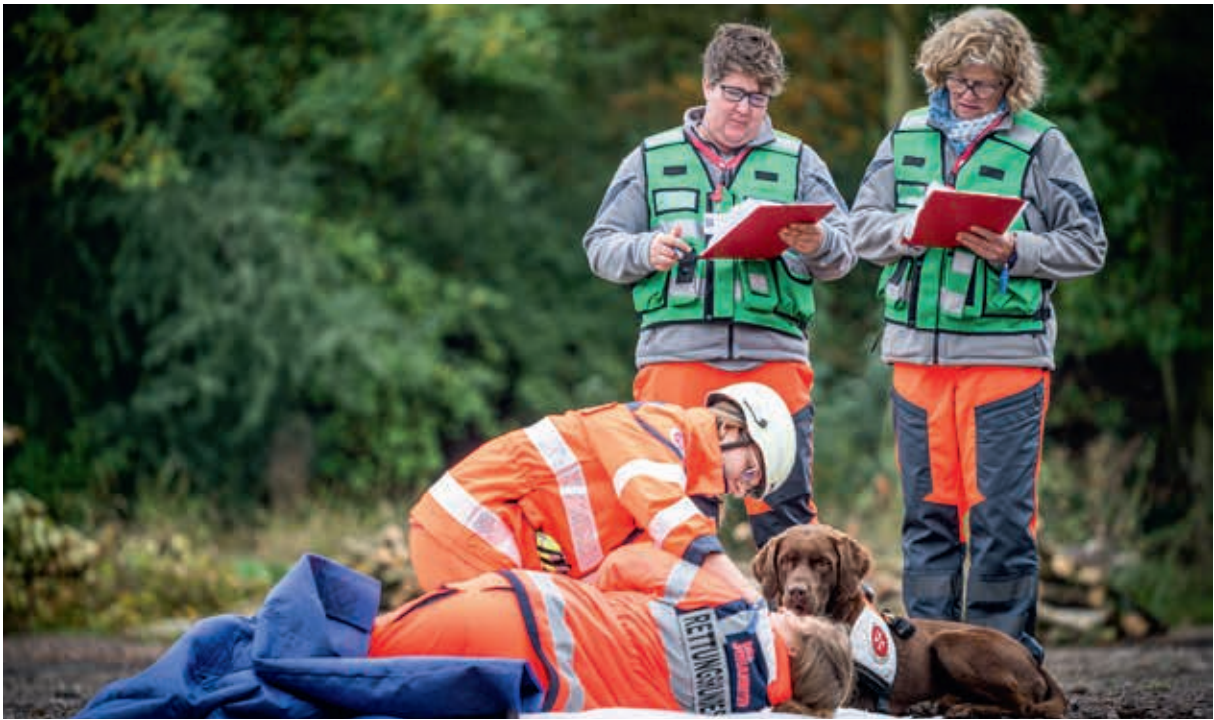
Der Rettungshund hat seine Arbeit getan. Nun muss die „gefundene Patientin“ erstversorgt werden. Jeder Fehler wird dokumentiert.