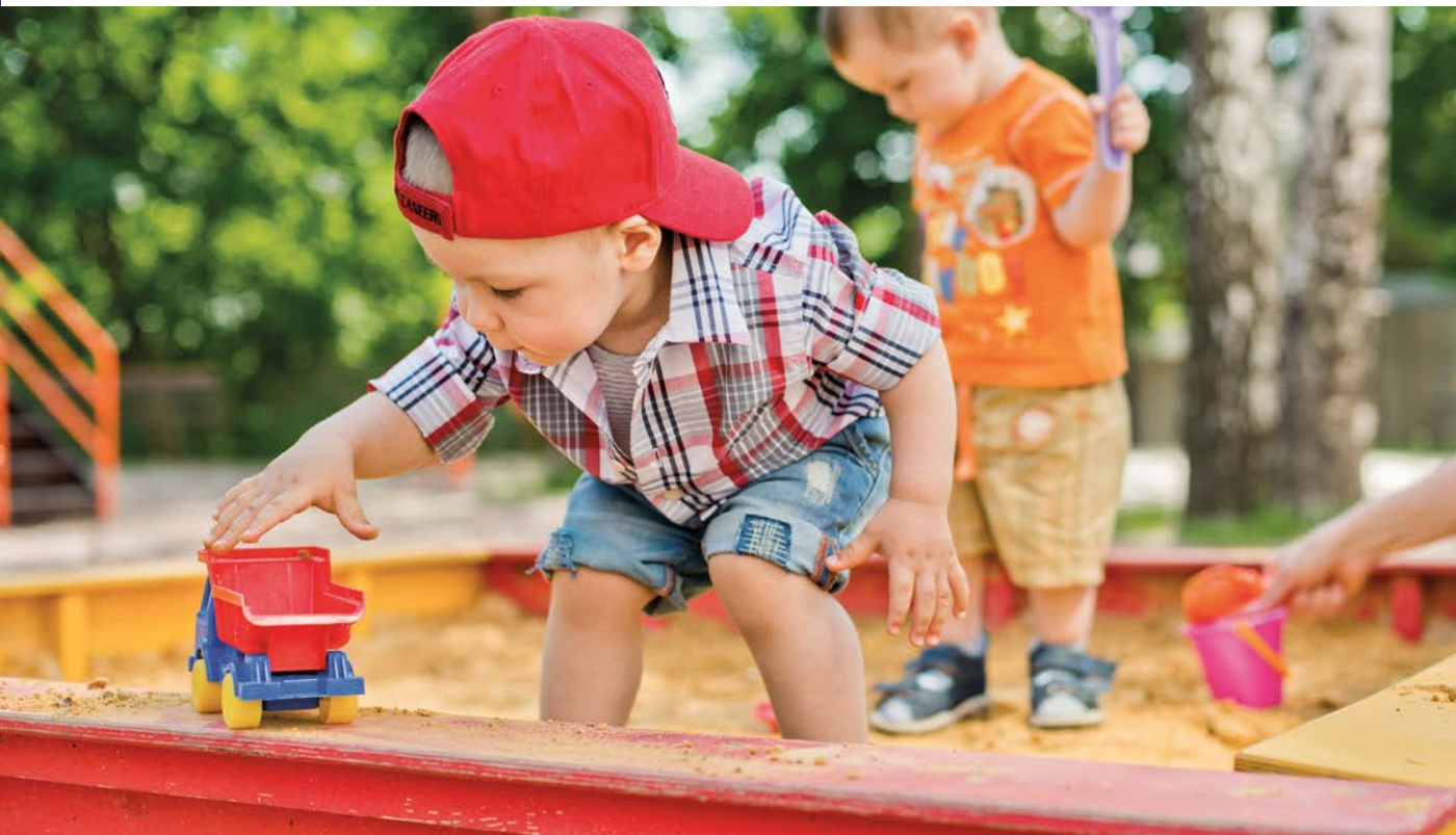
Foto aus dem Spendenflyer für den Spielplatz am Johanniter-Krankenhaus in Stendal