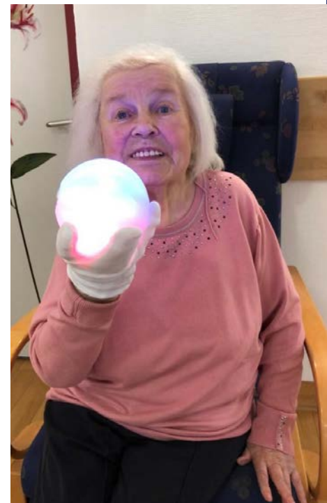
Vom Therapieball begeistert.

Der Therapieball „Ichó“ wurde von einem Duisburger Start-up-Unternehmen entwickelt, um die kognitiven und motorischen Fähigkeiten von Jung und Alt auf spielerische, interaktive Art und Weise zu fördern. Der Name leitet sich aus dem Griechischen ab – Ichó bedeutet Echo.