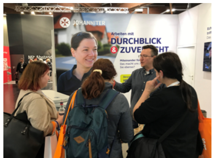
Für eine fachkundige Standbetreuung war gesorgt.