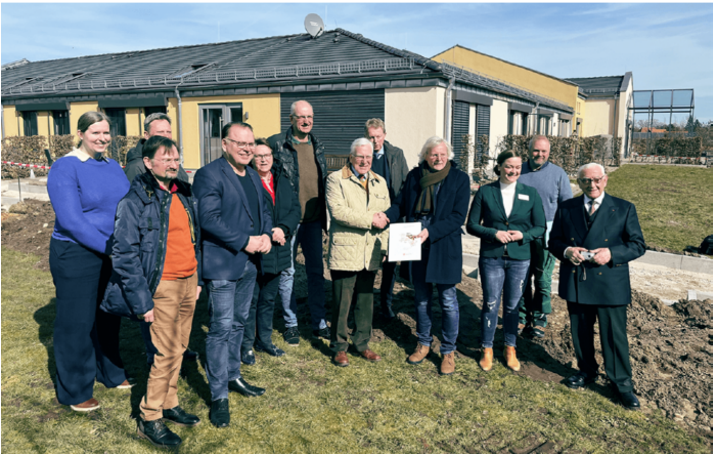
Feierliche Übergabe des Förderbescheids

*LEADER ist ein Maßnahmenprogramm der EU und bedeutet: Liaison entre actions de développement de l'économie rurale - Verbindung zwischen Aktionen zur Entwicklung der ländlichen Wirtschaft