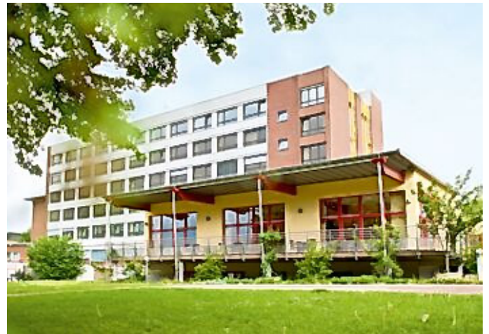
Das Evangelische Lukas-Krankenhaus Gronau

Wir, das sind eingespielte Teams in beiden Fachrichtungen, die sich neben hoher fachlicher Kompetenz vor allem durch interdisziplinäre Zusammenarbeit auf