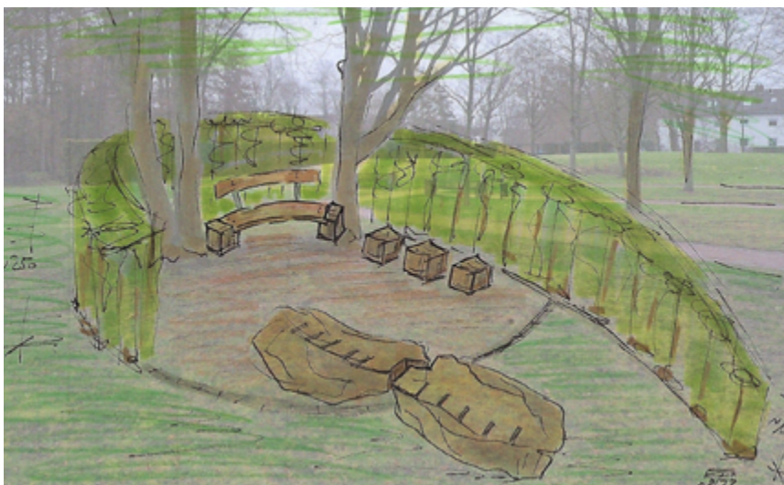
Der neue Trauerort im Garten der Psychiatrie im St. Marien-Hospital in Hamm ist jederzeit frei zugänglich und soll die Trauer Betroffener „auffangen“.