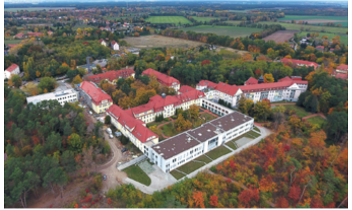
Luftbild von 2020 aus einer anderen Perspektive: Deutlich heben sich zwei Neubauten und der zusätzliche Innenhof ab.