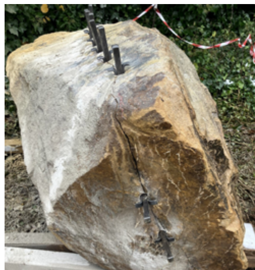
Der Felsen, der im Rahmen der Kunsttherapie symbolisch aufgespalten wurde, bildet den Mittelpunkt des neu geschaffenen Bereichs.