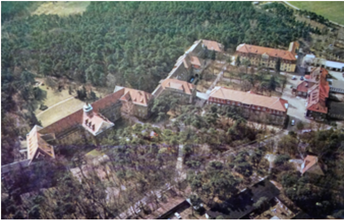
Nicht nur im Außenbild hat sich viel verändert: Eine Postkarte aus dem Jahr 1994 zeigt die Krankenhausanlage in ihren historischen Grundzügen.