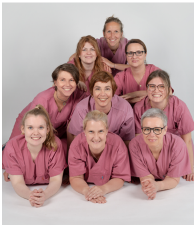
Mitarbeiterinnen des Teams der Geesthachter Geburtshilfe

Kritisch sehe ich dabei, dass die an uns gesetzten Erwartungen und Vorgaben sehr hochgesteckt werden, jedoch im starken Widerspruch zu den derzeitigen politischen Rahmenbedingungen und vor allem auch zur Vergütung in der Geburtshilfe stehen: Es gibt immer noch zu viele monetäre Fehlanreize, wie etwa, dass ein Kaiserschnitt aus finanzieller Sicht deutlich attraktiver ist als eine spontane Geburt, obwohl die gleichen Vorhaltekosten bestehen. Geburtshilfe ist eben nicht planbar: Während an einem Tag keine Geburt stattfindet, sind es am nächsten gleich fünf auf einmal. Zu hinterfragen ist auch die durch die Krankenhausreform angestrebte Zentrenbildung, die sich darauf gründet, dass Mindestmengen für höhere Qualität sorgen sollen. In der Geburtshilfe ist das nachweislich nicht so. Eine Geburtsklinik mit jährlich 3.000 Geburten bietet nicht automatisch eine bessere Geburtshilfe als eine kleinere Klinik, wie z. B. wir in Geesthacht mit 750 Geburten, die aber mit einem guten Konzept überzeugt. Gesellschaftlich müssen wir uns daher alle die Frage stellen: „Was ist uns gute Geburtshilfe wert?“