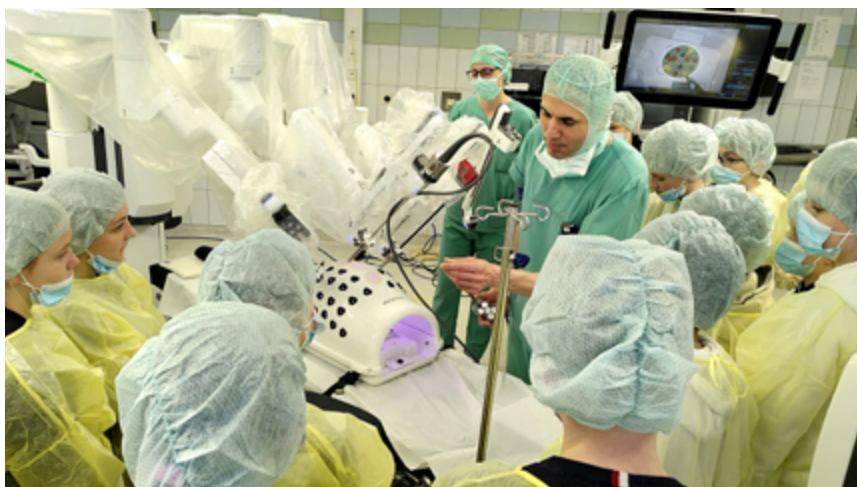
Mittendrin statt nur dabei: In Mönchengladbach konnten die jungen „Nachwuchs-Chirurgen“ ihre Fähigkeiten am OP-Roboter testen.

Der „Girls'Day“ und „Boys'Day“ ist auch etwas für Ihre Einrichtung? Weitere Informationen zur Teilnahme finden Sie unter: