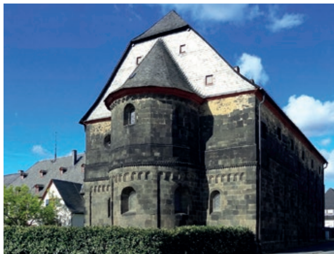
Komturkirche