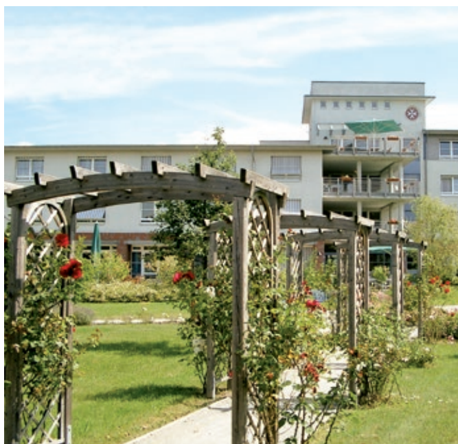
Das Johanniterhaus Rieseberg in Gardelegen verfügt über 112 Pflegeplätze