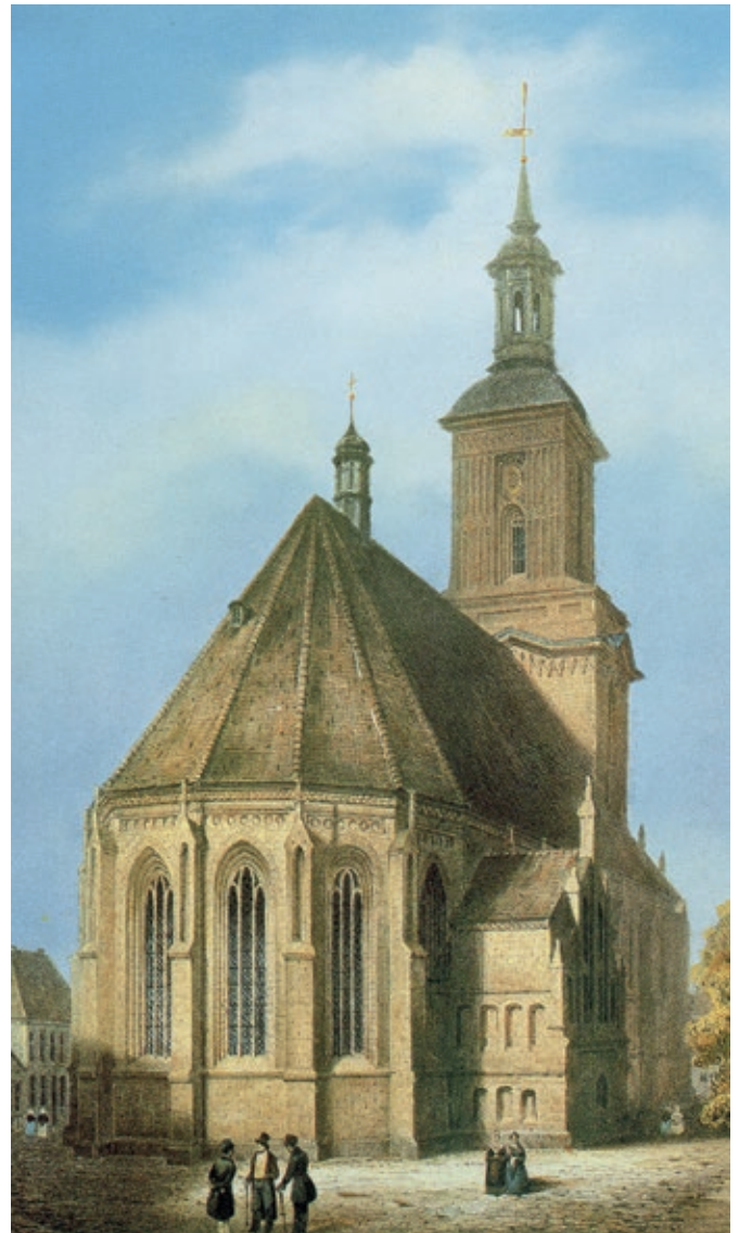
Der Chor der St. Nikolai-Kirche von Osten, Lithografieauschnitt, etwa Mitte des 19. Jahrhunderts