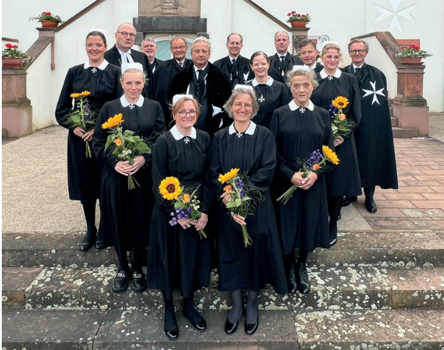
Die neu ernannten Johanniterschwestern mit dem Herrenmeister, dem Ordensdekan, der Ordensoberin und Mitgliedern des Fördervereins